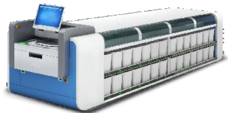
静配中心智 能分拣机