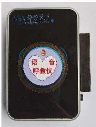
多功能 语音呼救仪