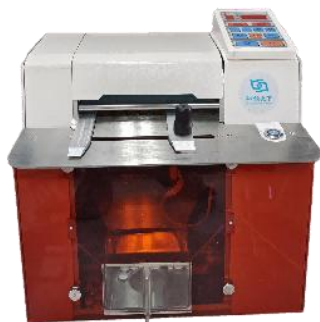
医院全自动 剥药机