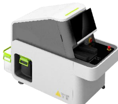
静配中心智 能贴标机