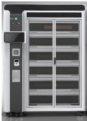
手术室智能 标本管控柜